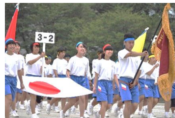
入場行進（生徒会役員）

ところで「読書の秋」といわれますが、皆さんは1年間に何冊位本を読みますか。読書については、「自立した大人として生きるために必要なものは、自分の頭で物事を考え、判断する力である。その基礎となるのは知識と教養であるが、それを育むために最も効果のある方法は、本を読むことによって得られる。読書こそ知識と教養の最大の源泉である。」という話を聞いたことがあります。また、『読書は、人生において重要な「健康」「お金」「時間」「人とのつながり」「自己実現・成長」など、ほとんどのものを与えてくれる』という人もいます。それに対して、「今はインターネットの時代である。あらゆる情報がネット上にあふれているから、検索すれば何でも分かる。読書の必要はない。」という極端な意見も耳にします。様々な意見があるとは思いますが、読書とインターネットの違いは、「知識・教養」と「情報」の違いであると考えます。読書から得られるのは、整理され体系化された「知識と教養」であり、人生において重要な判断が必要な時に役立つと思います。いずれにしても、自分で様々な内容の本を読み「知識と教養」を身に付けること、そして、いろいろな手段で必要な「情報」を得ること、この2つのバランスを取って主体的に生きていくことが重要ではないでしょうか。