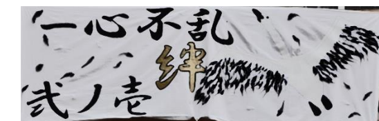
絆が深まったで賞（1-1）