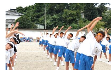
美しく揃ったラジオ体操